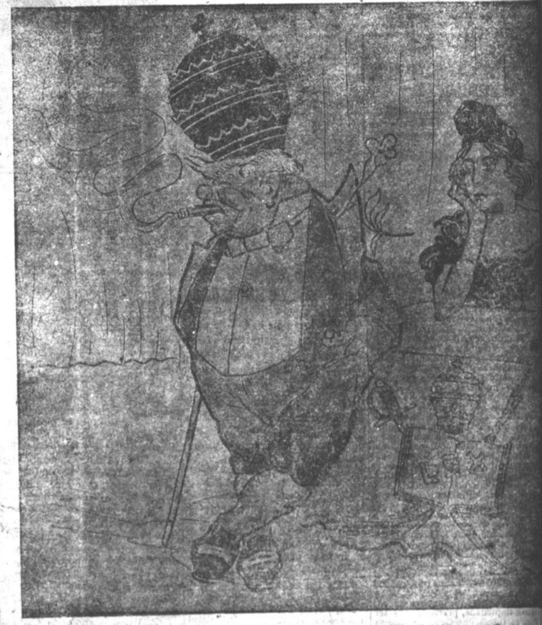
Hum a ameaça de suppressão da legação brasileira junto á Santa Sé perturbou os amores do nosso Pio com a madama cá da terra...

Queres comprehender, emfim, que sobre a mentira jesuitica nada de sólido, nem de vivo, se pode edificar? que não é sobre as palácios vis e baixas que deve apoiar-se a accção revolucionaria e que nunca a Revolução poderia triumphar se não tivesse por fim um ideal elevado, humano, bem claro. — Miguel Baccanina.